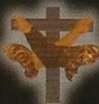
Familia Franciscana de la Región de Murcia