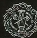
Hermandad del Stmo. Cristo Amarrado a la Columna de Jumilla